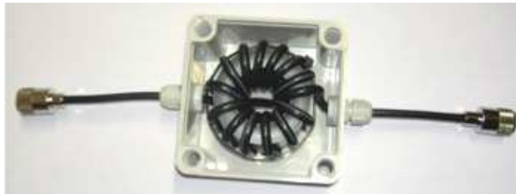
防水防塵ボックス内部